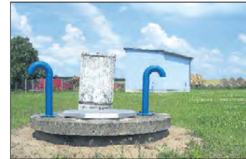
Das Wasserwerk Görzig

hauptamtlichen Vorstandsvorsteherin gewählt.