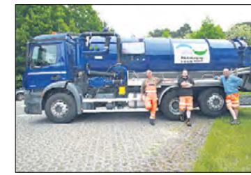
Mitarbeiter der mobilen Entsorgung vor einem der Spezialfahrzeuge.

Mit dem Urteil des OVG Berlin-Brandenburg wird die Heranziehung unterschiedlicher Mengengebühren für Beitrags- und Nichtbeitragszahler bestätigt. Der WAZV kündigt den Vertrag zur mobilen Entsorgung, um diesen Bereich in Eigenregie zu übernehmen. Dafür werden zwei Fäkalfahrzeuge und ein Saug-Spül-Kombifahrzeug angeschafft und zwei Mitarbeiter eingestellt. In Verbindung mit Straßenbaumaßnahmen der Stadt Beeskow wird in das Trink- und Abwassernetz investiert, z. B. 2. BA Schützenstraße/Rouanetstraße und Suleciner Platz.