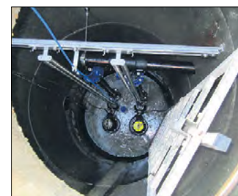
Eins der 42 Hauptpumpwerke des Verbandes.

großen und stark verdünnten Abwassermengen, zu spüren.