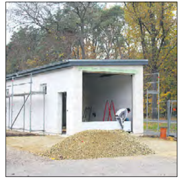
Neue Technik – neue Garage