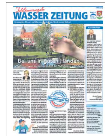
20 Jahre – Jubiläumsausgabe

Im März erscheint – zum 20-jährigen Jubiläum – die erste Ausgabe