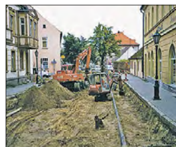
Auswechslung der Leitung in der Berliner Straße in Beeskow.

Die rechtmäßige Gründung des Zweckverbandes wird erneut geprüft und bestätigt.