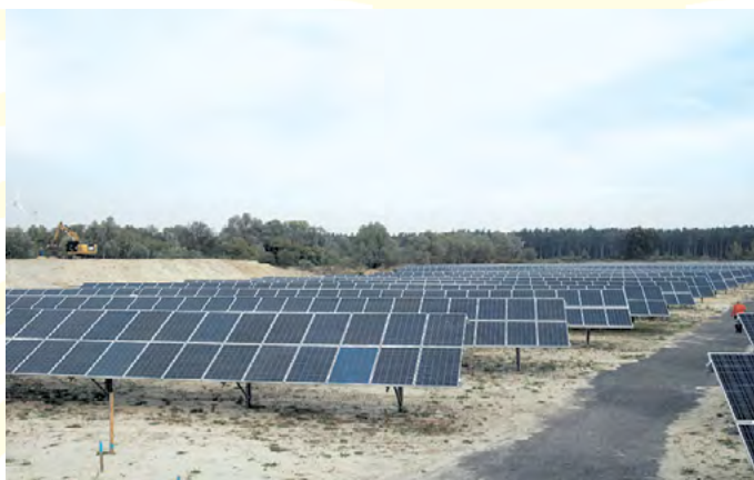
Eine zuverlässige Mitarbeiterin ist die Sonne. Sie versorgt die Solaranlage des WAZV, die direkt bei der Kläranlage Beeskow installiert ist.