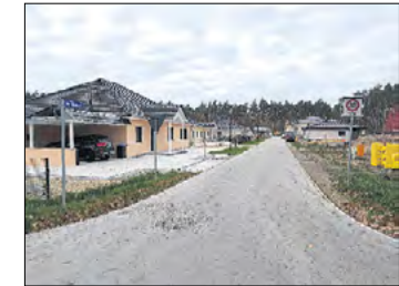
Erschließung "Am Südwald".

Die Wohngebiete „Am Bahrendorfer See“ und „Am Südwald“ werden erschlossen. In der Radinkendorfer Straße wird die Trinkwasserleitung erneuert. Der WAZV kauft für den Trink- und Abwasserbereich einen Traktor mit Hänger und Zusatzgeräten. Auf den Dächern der Wasserwerke Görzig und Buckow werden Photovoltaikanlagen errichtet.