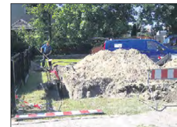
Errichtung eines Hausanschlusses.

Die Trinkwasserleitungen „Im Luch“ und in der Gartenstraße werden erneuert. Corona bestimmt das komplette Leben. Alle Arbeitsabläufe müssen überdacht werden. Neue Arbeitsteams mit unterschiedlichen Arbeitszeiten werden gebildet und es wird geprüft, in welchen Bereichen und in welchem Umfang Homeoffice möglich ist.