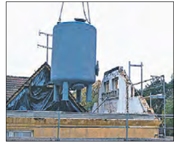
Montage der Filterkessel im Wasserwerk Beeskow.