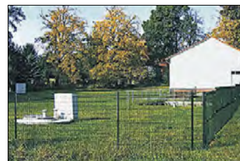
Das Wasserwerk Buckow nach seiner Rekonstruktion.

Die Märkische Wasserversorgung und Abwasserbehandlung GmbH, die aus dem VEB WAB hervorgegangen war, überträgt das Anlagevermögen in Höhe von 9,1 Millionen Euro sowie Kredite in Höhe von 4,2 Millionen Euro auf den WAZV