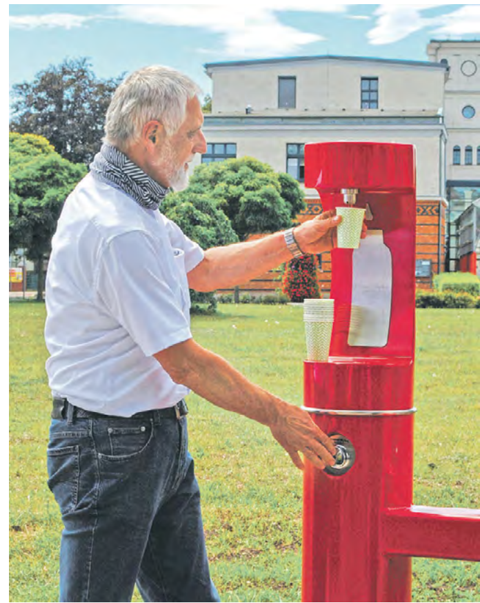
Am Gubener Dreieck können bereits seit Juli 2020 Mensch und sogar Hund ihren Durst stillen!

Dass Trinkwasser rund um die Uhr zuverlässig aus dem heimischen Hahn fließt – eine Selbstverständlichkeit. Nun wünscht sich der Gesetzgeber aber auch in Parks, Fußgängerzonen oder an touristischen Hotspots noch mehr (kostenlosen!) Zugang zum Lebensmittel Nr. 1. So soll Plastikmüll durch abgefülltes Wasser vermieden und am Ende CO 2 -Ausstoß gesenkt werden. Eine Nachfrage der WASSER ZEITUNG in den Rathäusern unseres Verbreitungsgebietes zeigt ein eher verhaltenes Echo, was neue Wasserspender oder Brunnen angeht.