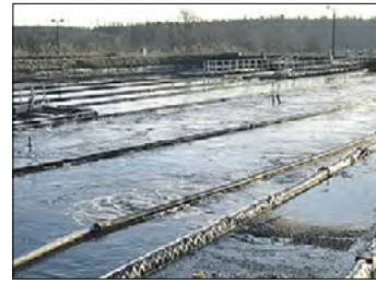
Belebungsbecken der Kläranlage Beeskow.