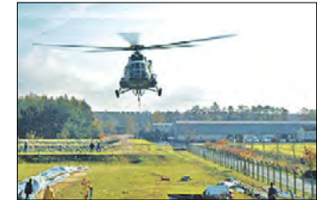
Hubschraubereinsatz auf der Beeskower Kläranlage.