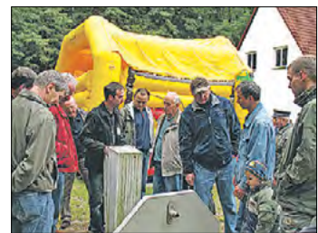
Besucherandrang beim Tag der offenen Tür.

Mit der Schließung der Milchwerke zum 31. März verliert der WAZV einen Großkunden. Ein Drittel des im Stadtkern Beeskow verkauften Trinkwassers wurde von den Milchwerken abgenommen. Die umfangreiche Rekonstruktion des Wasserwerkes Beeskow ist abgeschlossen. Das 15-jährige Bestehen des Zweckverbandes wird mit einem Tag der offenen Tür gefeiert. Der Betriebsführungsvertrag Abwasser mit der Firma Lidzba Reinigungsgesellschaft mbH endet. Der WAZV übernimmt den Bereich Abwasser mit drei Mitarbeitern in Eigenregie.