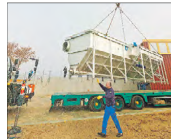
Schwebend erreicht der vier Tonnen schwere Rechen sein Ziel. Das Herzstück der Anlage: die Siebtrommel.

Das Schlamm-trockenbeet 2 der Kläranlage wird erneuert. Die 1. Reinigungsstufe der Kläranlage wird mit einem Tag der offenen Tür in Betrieb genommen.