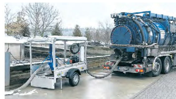
Man sieht dem kleinen Anhänger nicht an, was er für die mobile Entsorgung leistet.