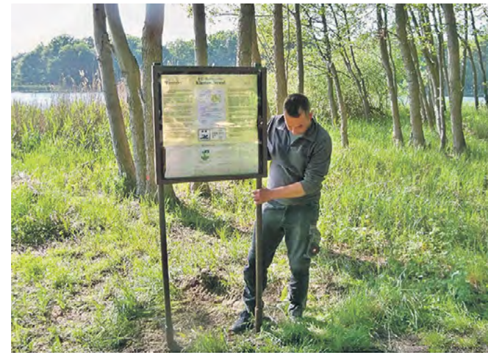
Unmengen an Müll – von Autoreifen über Fässer und Batterien bis hin zu Bahnschwellen – entfernen die Petrijünger aus dem See und von seinem Ufer. Zur touristischen Aufwertung bringen sie wissensvermittelnde Schautafeln an.

Wir wünschen dem Anglerverein Trebbin e.V., dass die 1.000 Euro vom „Großen Preis der WASSER ZEITUNG“ ihren Beitrag dazu leisten, den Kliestower See zu alter Blüte zu führen.