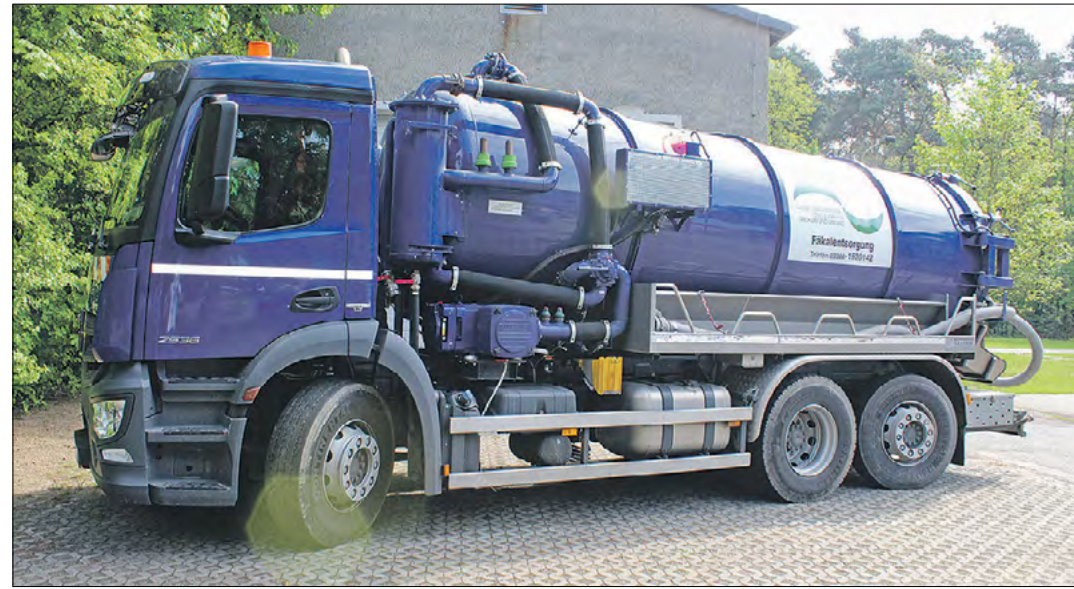
Ein Fäkalfahrzeug des WAZV: Auch im Winter ist das Team im Einsatz, um dezentrale Sammelgruben zu entleeren. Ein Saugstutzen an der Grundstücksgrenze ist dafür die beste Lösung.

Saugstutzen schaffen Flexibilität und reduzieren die Kosten. Und im Winter schaffen sie sowohl für die Grundstückseigentümer als auch für die Entsorger nochmal eine enorme Arbeiterleichterung. Denn egal zu welchen Jahreszeiten und bei welchen Witterungsverhältnissen – die Gruben müssen immer frei zugänglich sein. Das bedeutet in den kalten Monaten eben auch schnee- und frostfrei.