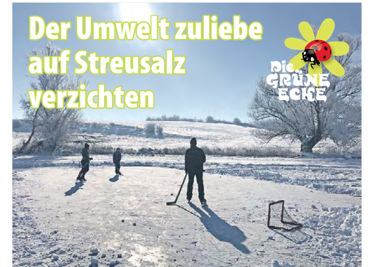
Abseits vom Wintersport sollten Flächen besser weniger rutschig sein. Der Einsatz von Streusalz ist dafür nur bedingt empfehlenswert.

Das Erkennen und vor allem die kurzfristige Umsetzung von Maßnahmen bewirken, dass der Verband seinen Kunden trotz der jetzt notwendigen Erhöhungen, relativ niedrige Entgelte und Gebühren anbieten kann.