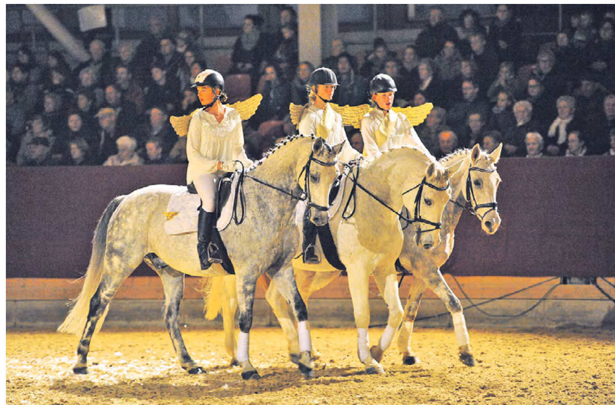
Kleine und große Pferdefreunde werden in Neustadt/Dosse die Eleganz und Geschicklichkeit prächtiger Tiere bestaunen. Auch Humor kommt in den teils rasanten Pferdeschaubildern zu weihnachtlicher Musik nicht zu kurz. Die Reiterinnen und Reiter in ihren festlich-bunten Kostümen bieten sportlichen Hochgenuss.