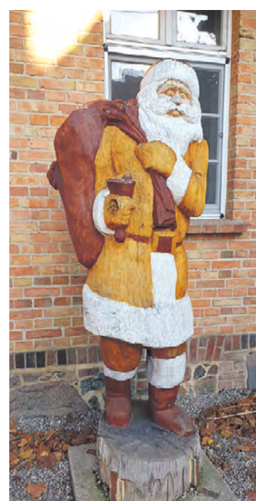
Der „hölzerne“ Weihnachtsmann in Himmelpfort ist ein sehr beliebtes Fotomotiv.