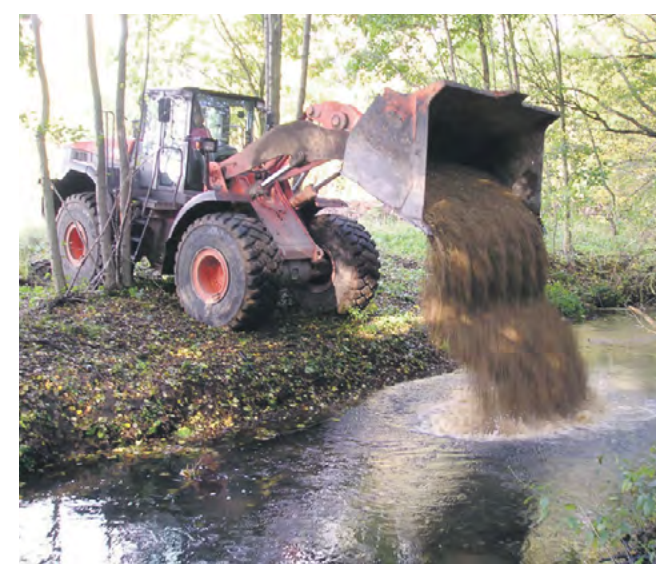
Mit schwerem Gerät rücken die Mitglieder des Kreisanglerverbandes Luckenwalde an, wenn „ihre“ gehegten Bachläufe wieder neuen Kies benötigen.

„Kies für Kies“ – so hatte der Kreisanglerverband seine Hoffnungen in der Bewerbung um den „Großen Preis der WASSER ZEITUNG“ formuliert. Wir sagen: bitteschön!