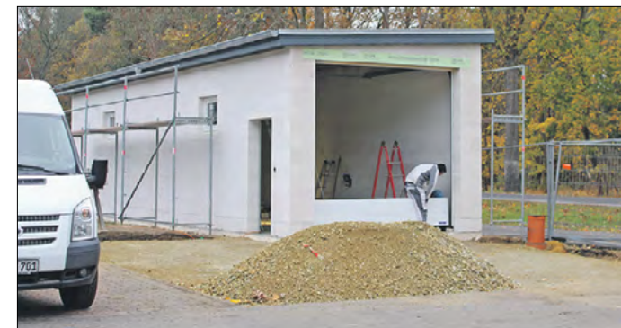
Links: Bisher gibt es den Doppelwellenzerkleinerer beim WAZV nur auf dem Papier, doch im kommenden Jahr soll die clevere und kostensparende Technik bei der mobilen Fäkalannahme eingesetzt werden. Oben: Auf dem Betriebsgelände des WAZV entsteht aktuell eine Doppelgarage, in der bald zwei Transporter untergebracht werden sollen.